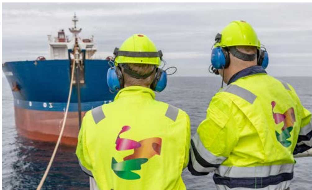
Folkene som går til søksmål mot arbeidsgiver Aker BP jobber både offshore og på land.