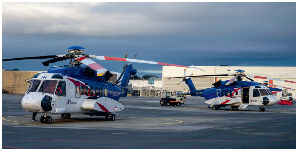
Flere Sikorsky S92-maskiner risikerer å bli satt på bakken framover på grunn av delemangel.