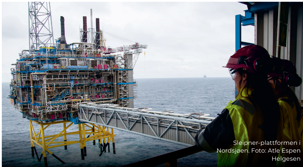
Sleipner-plattformen i Nordsjøen.