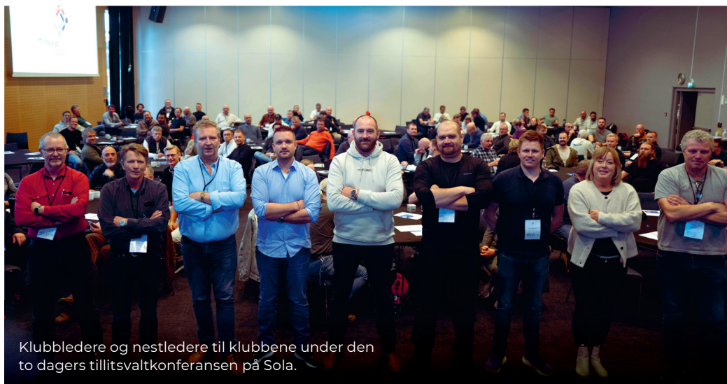
Klubbledere og nestledere til klubbene under den to dagers tillitsvaltkonferansen på Sola.

Han understreker at en trent kvinne i 50-årene, vil ha vanskeligheter med å oppnå samme verdi i VO 2 max som inaktive yngre menn, og inaktive menn i samme alder.